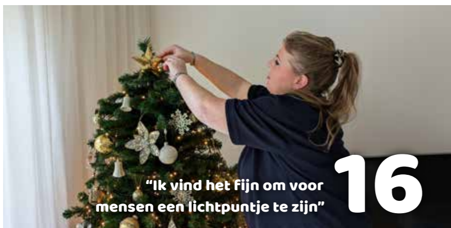
"Ik vind het fijn om voor mensen een lichtpuntje te zijn"