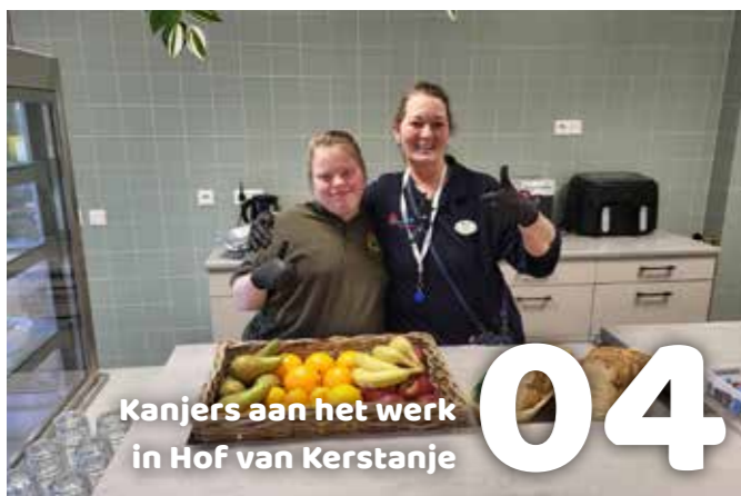
Kanjers aan het werk in Hof van Kerstanje