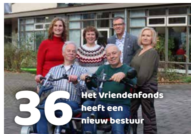
Het Vriendenfonds heeft een nieuw bestuur